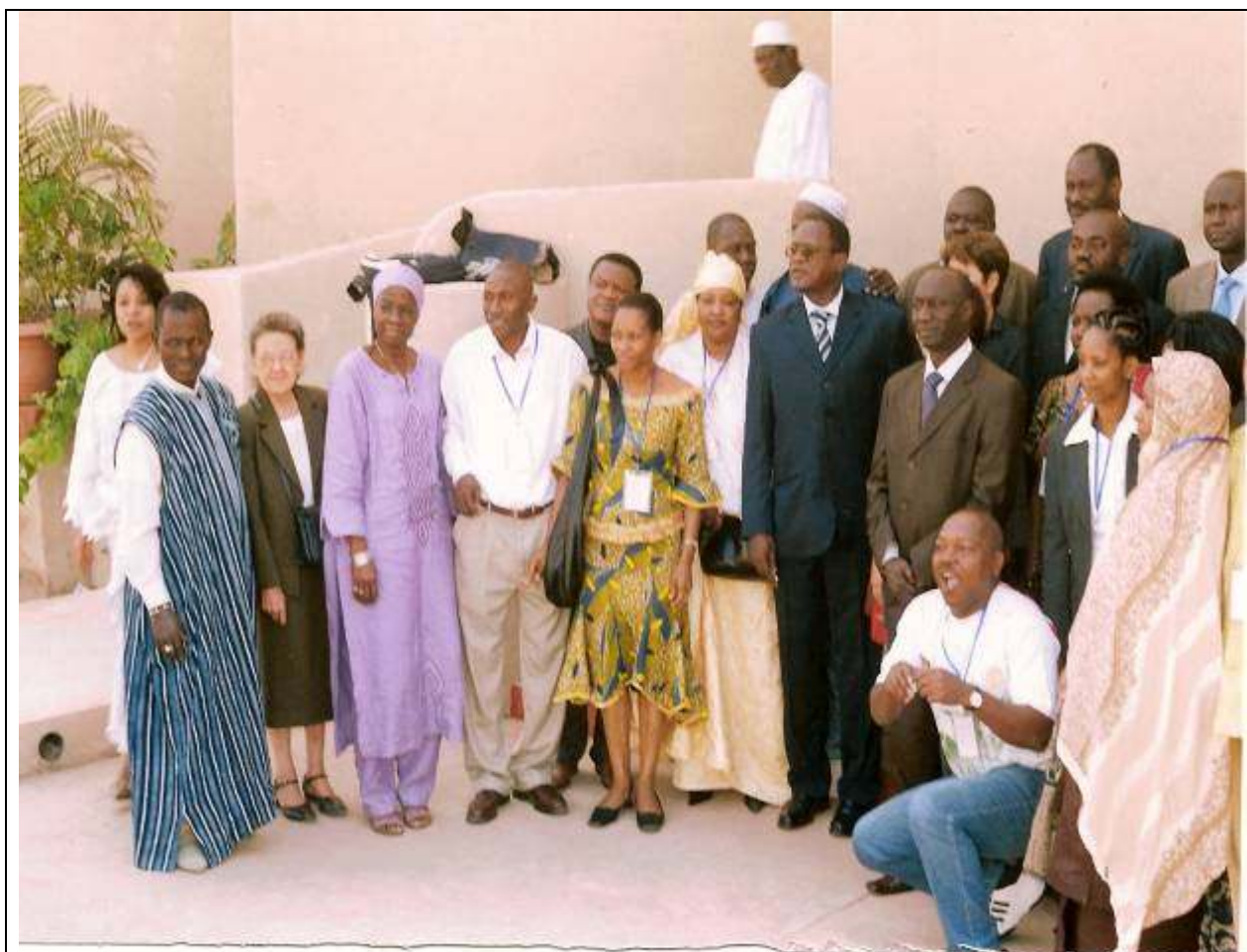
Participants à la récente rencontre sous régionale préparatoire de la CONFITEA VI organisée à Dakar du 26 au 29 mars 2008 sous l'égide de l'ICAE, et dont l'ouverture a été présidée par le Ministre sénégalais de la Culture et de l'Alphabétisation (au centre en costume bleu).